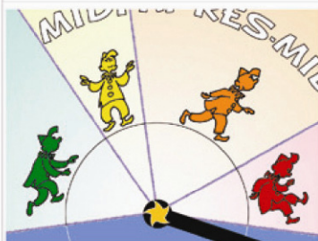
Gros plan sur les bonshommes qui donnent le sens des aiguilles