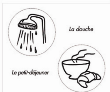
Exemples de pictos