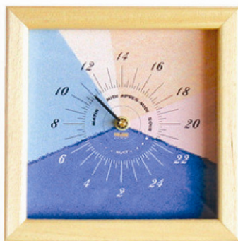
Modèle "Petite vitrine" visuel plus dépouillé

© APF 2007 RÉSEAU NOUVELLES TECHNOLOGIES ☎ 03 20 20 97 70